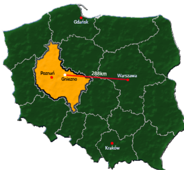
Mapa 1. Gniezno na tle Polski